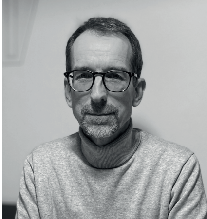
Dir. Walter Innerhofer